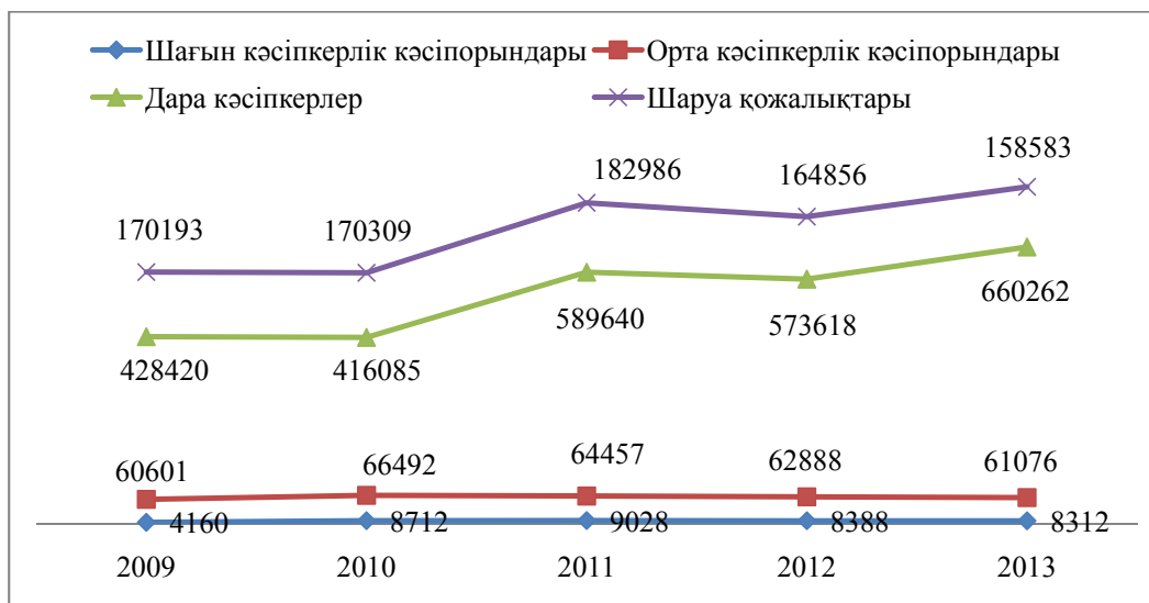
2-сурет – ШОК белсенді субъектілер санының даму серпіні

Дерек көзі: ҚР Статистикалық агенттігінің мәліметтеріне сүйене отырып, автормен құрастырылған [2]