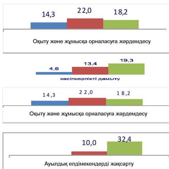
1-сурет – 2011-2013жж. Жұмыспен қамту 2020 бағдарламасын қаржыландыру (млрд теңге)

Ескерту: ҚР Статистика Агенттігінің мәліметіне сәйкес құрастырылды