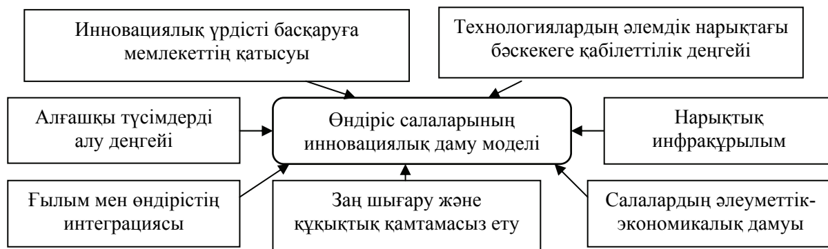
2-сурет. Инновациялық даму факторларының жиынтық моделі

Бұл модельдер мемлекеттік және нарықтық құрылымның өзара қарым-қатынас механизмін көрсетеді. Осыған байланысты өндіріс салаларын инновациялық дамытудың барлық факторларының қарым-қатынасын ескеретін жинақталған моделін қалыптастыру қажеттігі туындайды. Зерттеулер нәтижесінде өнеркәсіп салаларының инновациялық дамуының жағдайын және инновациялық үрдістердің дамуындағы мемлекеттің қатысуын ескертіп, кеңейтілген модель негізінде өндіріс салаларының инновациялық дамуының алғы шарты ретінде даму факторларының жиынтық моделін қалыптастыру дұрыс болып табылады. Инновациялық даму факторларының жиынтық моделі 2-суретте көрсетілген.