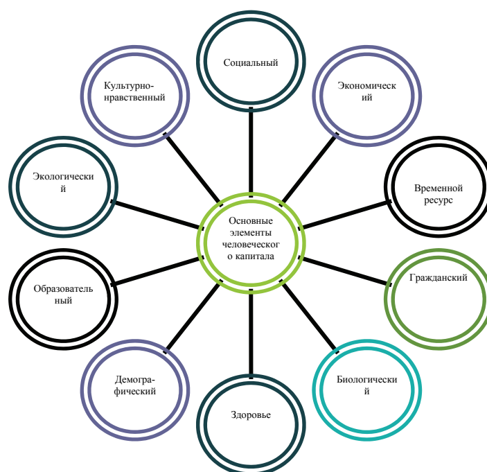
Рисунок 1 – Основные элементы человеческого капитала