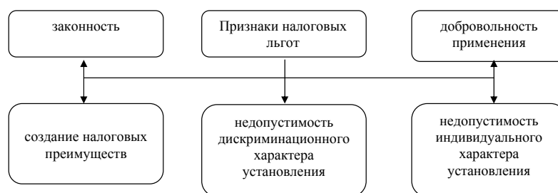
Рисунок 2 – Признаки налоговых льгот