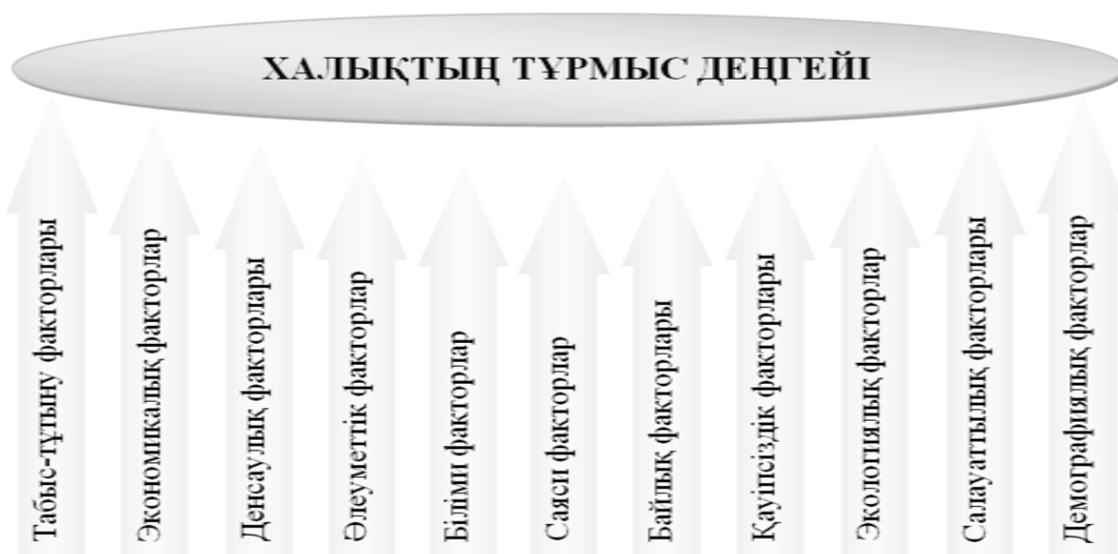
2-сурет – Халықтың тұрмыс деңгейіне ықпал етуші негізгі факторлардың тобы

Халықтың тұрмыс деңгейін факторлық топтарға жіктеу арқылы тұрмыс деңгейінің түрлі өрістерінің әрқайсысының жекелей деңгейлерін, ортақ белгілері бойынша топтық деңгейлерін және тұрмыстың жалпы деңгейлерін ажыратып бағалауға мүмкіндік туындайды.