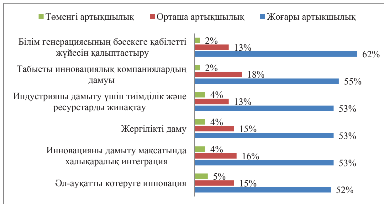
1-сурет – Қазақстанның 2020 жылға дейінгі ғылыми-технологиялық дамуының мақсаттары Ескерту: дерек көзі бойынша автор құрастырған [5, 46 б.]

пы білім беретін мектептердің педагогтерін өз жұмыстарына айтарлықтай түзетулер енгізуге міндеттейді [4].