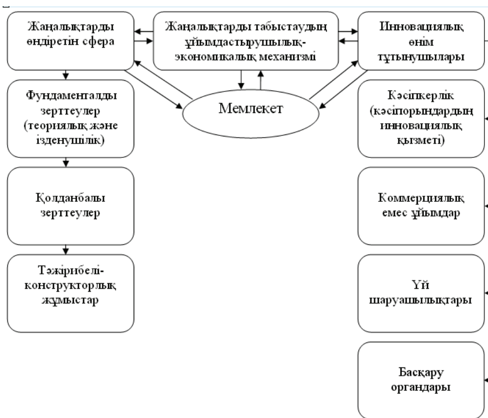
1-сурет. Инновациялық процесс құрылымы

процесс, өндірісті ұйымдастыру мен басқарудың жаңа тәсілдері түрінде қолданудан тұратын жүйелі жұмыстардың кешені болып табылады. Оны келесі буындардан тұратын құрылым ретінде көрсетуге болады: жаңалықтарды өндіретін сфера, жаңалықтарды табыстаудың ұйымдастырушылық-экономикалық механизмі, инновациялық өнім тұтынушылары. Инновациялық процесс құрылымы 1-суретте көрсетілген.