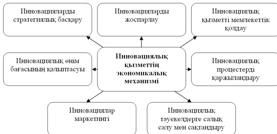
2-сурет. Агроөнеркәсіптік кешендегі инновациялық қызметтің экономикалық механизмінің құрылымы

Сондықтан инновацияларды басқаруда тек қана экономикалық заңдардың ғана емес, сонымен қатар табиғат заңдарының талаптарын ескеру қажет: теңдік, орын баспаушылық, өмірлік факторлары, минимум, оптимум мен максимум заңдарының жиынтығы. Өндіріс факторларының орын баспаушылық заңының қолданысы, мысалы, тыңайтқышты селекциямен ауыстыруға, сұрыппен агротехникадағы кемшіліктің орнын толтыруға, асылдандырумен жемнің орнын толтыруға болмайтын кездерінде көрініс табады. Минимум заңына сәйкес өндіріс өсімі минимумдағы фактормен тежеледі. Мысалы, мал өнімділігінің деңгейі жем рационындағы ең көп орын алатын затпен анықталады; максимум заңына сәйкес белгілі-бір пайдалы заттың мал қажеттілігінен көп тұтыну оның өнімділігінің жоғарлауына алып келмейді. АӨК-тегі инновациялардың кешенді сипаты инновациялық механизмге ерекше талаптар қояды (2-сурет). /3/