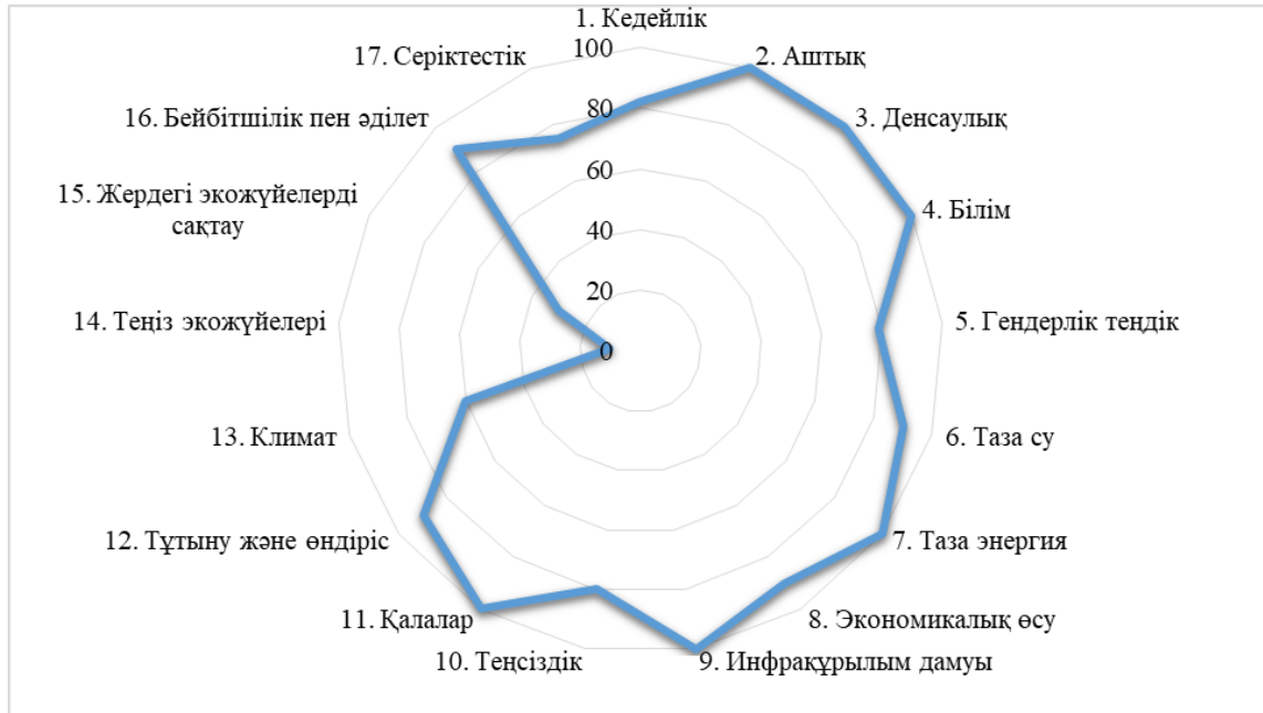
2-сурет – Мемлекеттік жоспарлау құжаттары жүйесіне ТДМ интеграциясы Ескерту: Қазақстан Республикасы Ұлттық статистика бюросы дереккөз негізінде авторлармен құрастырылған

тұрақты даму мақсаттарымен сенімді сәйкестігі, (Қазақстан Республикасының ерікті ұлттық шолуын қараңыз) осы саладағы тиімді мониторинг ұлттық және жаһандық саясаттың мақсаттарына қол жеткізуге ықпал ететінін болжайды.