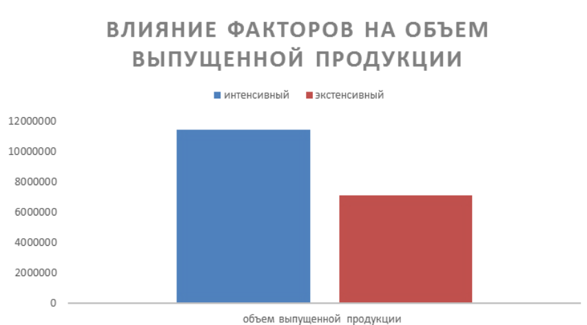
Рисунок 2 – Влияние факторов на объем произведенной продукции. Примечание: Сформирован на основании произведенных расчетов

По результатам произведенных расчетов сформирован рисунок 2, на котором можно наглядно увидеть влияние количественного и качественного факторов на объем произведенной продукции