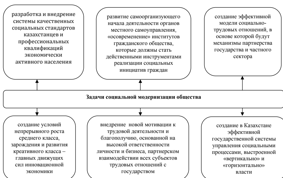
Рисунок 1 – Задачи социальной модернизации

Главные задачи, решаемые в рамках модернизационного процесса, представлены на рисунке 1.