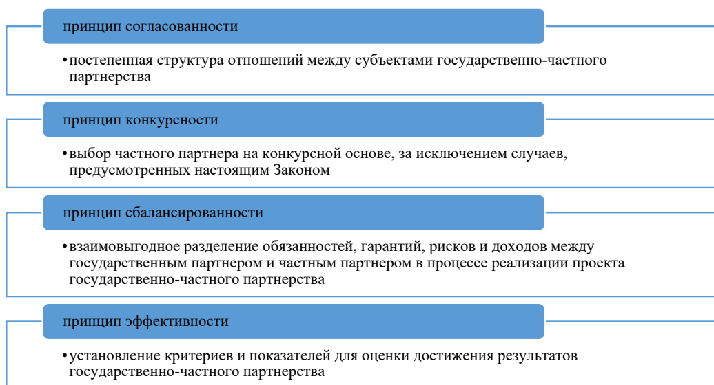
Рисунок 1 – Принципы государственно-частного партнерства

В связи с этим в отдельных областях республики созданы особые экономические зоны, которые являются важным элементом инфраструктуры для инновационной деятельности. Они представляют собой области с особым бизнес-режимом, предназначенным для обеспечения развития производства, высоких технологий и производства новых видов продукции. Это новая форма государственно-частного партнерства, которая широко распространена в Казахстане. Однако разработка и расширение списка особых экономических зон сопряжены с рядом проблем.