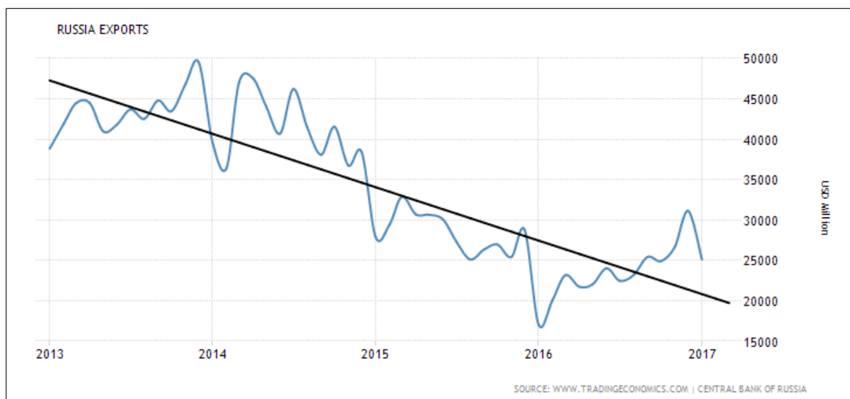
Рисунок 2 – Динамика экспорта российских товаров (в долларах США), 2013-2017 Примечание – составлено авторами на основе источника Trading Economics http://www.tradingeconomics.com/

изошло по причине уменьшения закупок в физическом выражении и сокращения средних импортных цен (рисунки 2, 3).