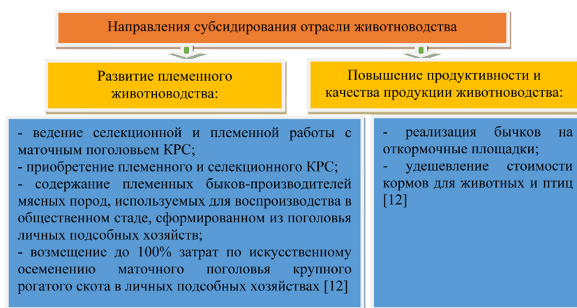
Рисунок 1 – Направления субсидирования отрасли животноводства в Республике Казахстан Примечание – Составлено автором

Субсидированию подлежат следующие направления отрасли животноводства (рисунок 1).