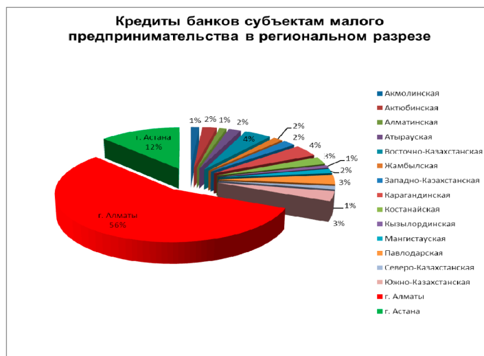
Рисунок 2 – Объем кредитования банков субъектам малого предпринимательства в 2015 году Примечание: составлено по источнику [6].

приятий города (АЖК, ГорВодоКанал, КазТрансГаз). В дальнейшем в планах осуществить оказание услуг в режиме «единого окна», чтобы предприниматель при обращении в Центр мог получить весь спектр услуг, в частности получение разрешительных документов [6].