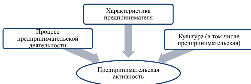
Рисунок 1 – Составляющие предпринимательской активности

Фактически, выражение любого предпринимательского поведения сильно зависит как от внутренней, так и от внешней среды. Наиболее важные элементы, определяющие предпринимательство, описаны в таблице 2.