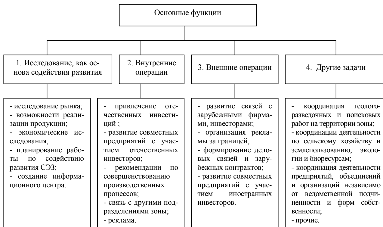
Рисунок 2 – Основные функции исполнительной дирекции Жайрем-Атасуйской СЭЗ

особо оговорено об учреждении целевых финансовых фондов, в том числе фонда инвестиций, что, конечно, объяснимо с точки зрения строительства новой столицы Казахстана.