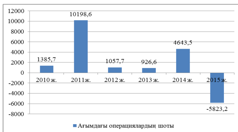
1-сурет – Ағымдағы операциялардың шоты, млн. АҚШ доллары Ескерту. 1-кесте мәліметтері бойынша құрастырылған.

мында ең көп құлдырау базалық кезеңмен салыстырғанда тауарлар экспортынан түсімдер және резидент еместердің инвестициялық кірістерінің төлемдері бойынша байқалды. Тауарлар экспортының құлдырау қарқыны тауар импортының төмендеу қарқынынан басым болды, нәтижесінде тауарлардың таза экспорты 2015 жылы 2014 жылмен салыстырғанда 3 есе дерлік (24 млрд. долл.) қысқарды. Тауар айналымының ІЖӨ-ге қатынасы ретінде есептелген экономиканың ашықтық көрсеткіші ІЖӨ-дегі экспорттың үлесі 11,8%-ға, ал импорт – 2,7%-ға азайған кезде 14,5%-дан 41%-ға дейін төмендеді. Жалпы ағымдағы операциялардың шоты бойынша өзгерістер динамикасын келесі 1-суреттен көруге болады.