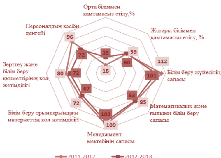
1-сурет – Қазақстанның жоғары білім беру және кәсіби даярлық деңгейі бойынша БЭФ рейтингісі

Мемлекеттің бәсекеге қабілеттілік көрсеткішінің тағы бір рейтингісі болып Менеджмент дамуының халықаралық институты (IMD, Швейцария, Лозанна қаласы) табылады [3]. Бұл рейтинг тек әлеуметтік-экономикалық реформалар белсенді жүргізілетін және бәсекеге қабілеттілігін жоғарылату бойынша мақсаттар қойылған мемлекеттер ғана іріктелінеді. ТМД елдері ішінде Лозанн институтының рейтингінде тек үш мемлекет қатысады – Қазақстан, Ресей және Украина. Бұл үш мемлекет ішінде Қазақстан алғашқы орындарда орналасуда.