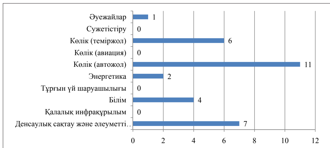
2-сурет – ҚР-да МЖЭ жобаларының саны, салалық құрылымда

Ескерту – [4] дереккөзі негізінде автормен құрастырылды