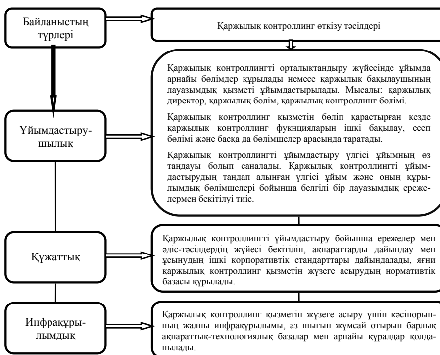
2-сурет – Қаржылық контроллингтің жалпы ұйымдастыру мен басқару жүйесімен байланысы

Демек, қаржылық басқару – басқару қызметтері және құралдары арқылы кәсіпорынның нәтижелі және тиімді қызмет етуін қамтамасыз ететін жүйе болып саналады.