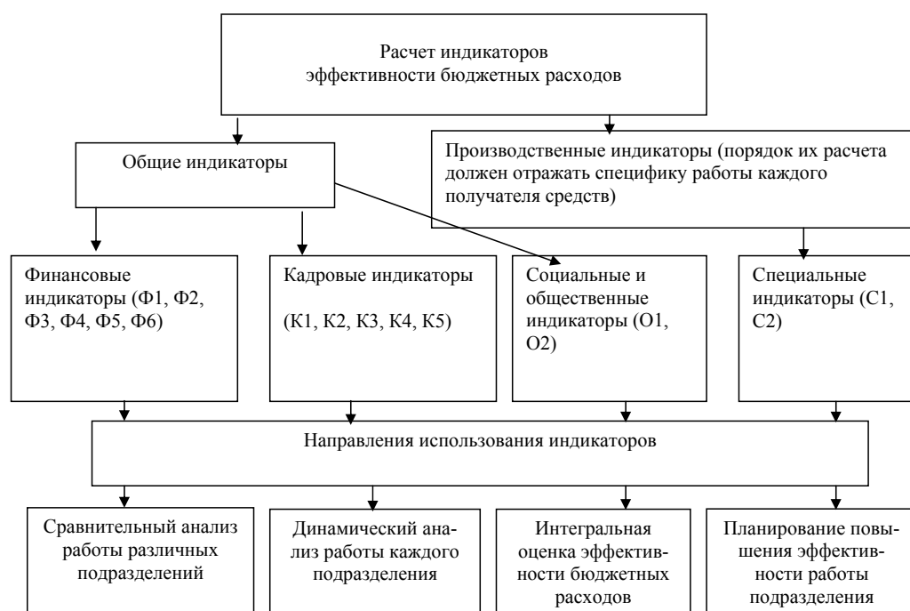
Рисунок 2 – Система показателей эффективности бюджетных расходов

Индикаторы С – специальные, например С1 – темпы роста строительства новых автомобильных дорог; С2 – темпы роста работ по ремонту автомобильных дорог.