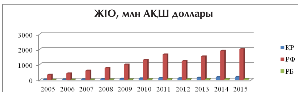
1-сурет – Қазақстан Республикасы, Ресей Федерациясы, Беларусь Республикасының 2005-2015 жылдар аралығындағы ЖІӨ динамикасы

Үш елдің арасында он жыл бойы, ең көп ЖІӨ – 89% Ресейде байқалады, сәйкесінше бұл уақытта Қазақстанда ЖІӨ – 6-9% арасында өзгеріп отырды, ал Белорусьте ЖІӨ – 2,8-3,8%-ды құрады.