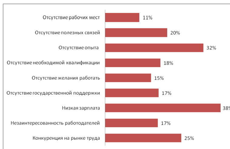
Диаграмма 1 – Основные причины молодежной безработицы в Казахстане [4]

кольку у многих из них нет навыков практической работы. В результате этого они не могут выполнить те или иные важные социально-экономические задачи производственной деятельности предприятия.