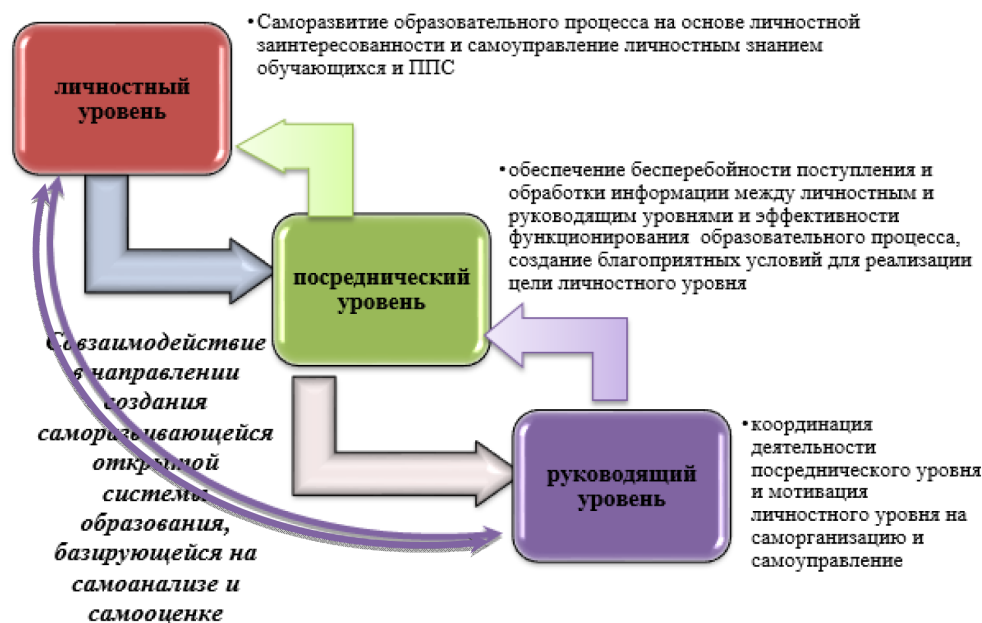
Рисунок 1 – Структурная модель синергетического менеджмента в вузе

Основным стимулом в саморазвитии, самооценке и самоанализе становится личностная заинтересованность в этих процессах как обучающихся, так и персонала и профессорско-преподавательского состава вуза.