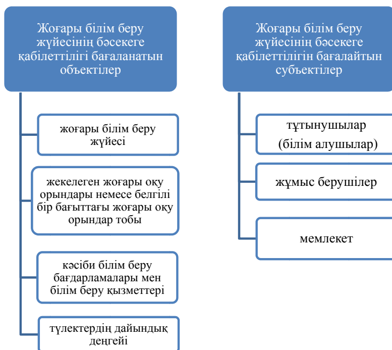
1-сурет – Жоғары білім беру жүйесінің бәсекеге қабілеттілігін бағалау объектілері мен субъектілері

лыстыру нәтижесінде анықталады. Бәсекеге қабілеттіліктің нарықтық қатынастар жағдайында байқалатындығын, яғни, бәсекені нарық туындататындығын ескерсек, оған мәндік (өнімнің сапасы) сипаттағы факторлармен қатар, конъюнктуралық (өнім бағасының төмендеуі) факторлар да әсер етеді. Сонымен бәсекеге қабілеттіліктің маңызды сипаттамасы салыстырмалылық болып табылады. Сапа болса, затты немесе құбылысты басқалардан ерекшелеп тұратын маңызды белгілердің, қасиеттердің, ерекшеліктердің жиынтығы ретінде қарастырылады. Бәсекеге қабілеттіліктен сапаның айырмашылығы: ол – жекелеген адамдардың немесе топтардың дербес түйсінугі негізінде айқындалады. Білім беру жүйесіне қатысты алатын болсақ, бұл өзара байланысты келесідей тұрғыда түсіндіруге болады: дәстүрлі білім беру жүйесі сапалы болғанменен, заманауи әлемде ол мүлде бәсекеге қабілетсіз болуы мүмкін.