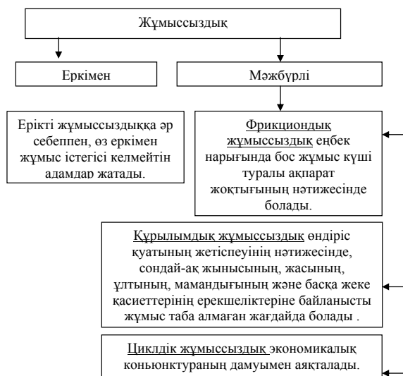
1-сурет – Жұмыссыздықтың негізгі түрлері