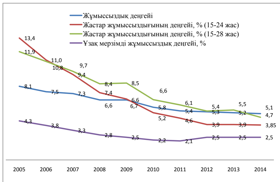
3-сурет – 2005-2014 жылдардағы Қазақстан Республикасының жұмыссыздық деңгейінің динамикасы

Аталған факторлар арасындағы мультикол- линеарлық мәселелерін жою үшін, корреля- циялық матрица құрылды.