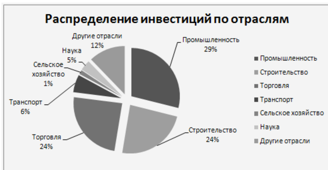
Рисунок 3 – Распределение инвестиций по отраслям в Евросоюзе

Северные страны Европы Дания, нидерланды ориентированы на сельское хозяйство, поэтому инвестирование этих стран заключается в поддержке этой отрасли экономики.