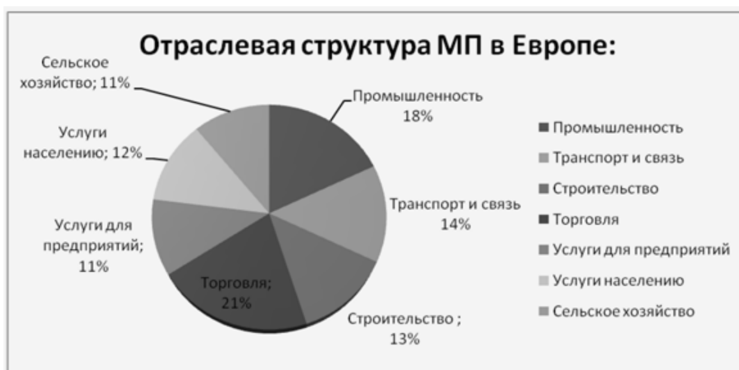
Рисунок 1 – Отраслевая структура малого предпринимательства в Европе

Наибольшее количество малых предприятий создано в торговле, строительстве и промышленности. Ниже представлены диаграммы отраслевых структур Европы и Азии [2].